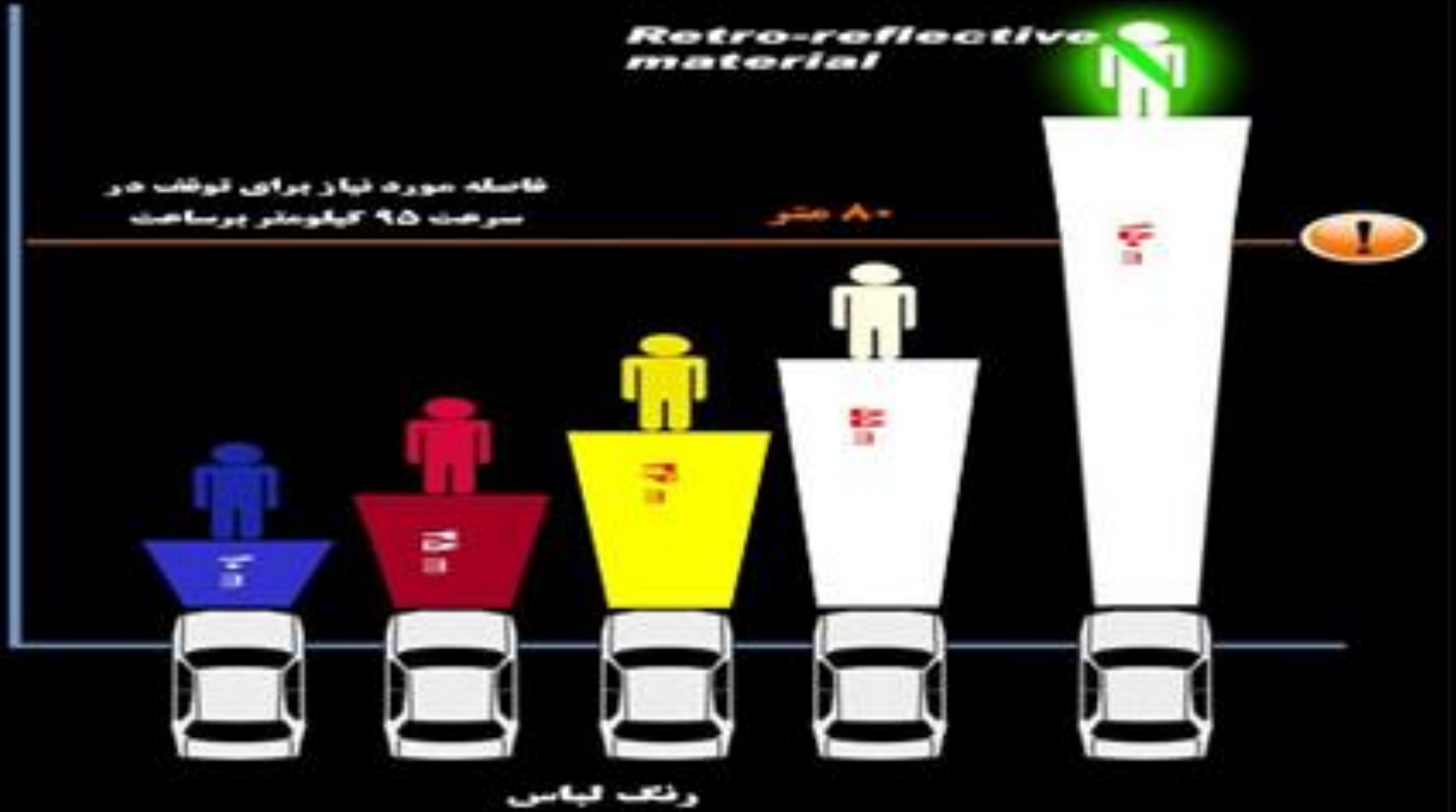
شکل ۵: تأثیر رنگ لباس و استفاده از شبرنگ در دیده شدن