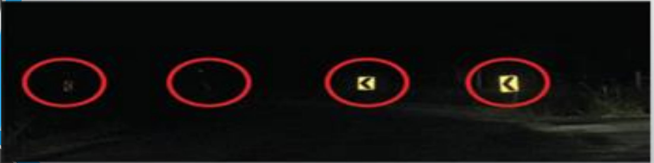
شکل ۶: قابلیت دیده شدن علائم راهنمایی در روز و شب