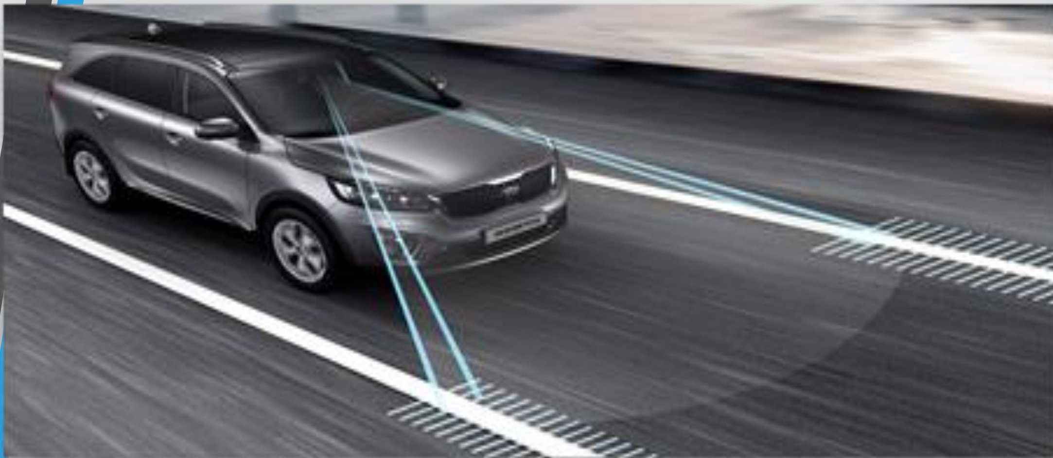
شکل ۸: فناوری تشخیص انحراف از مسیر