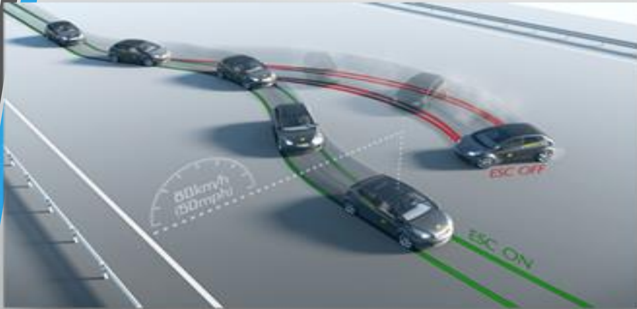
شکل ۹: تاثیر فناوری پایداری الکترونیکی در افزایش پایداری خودرو