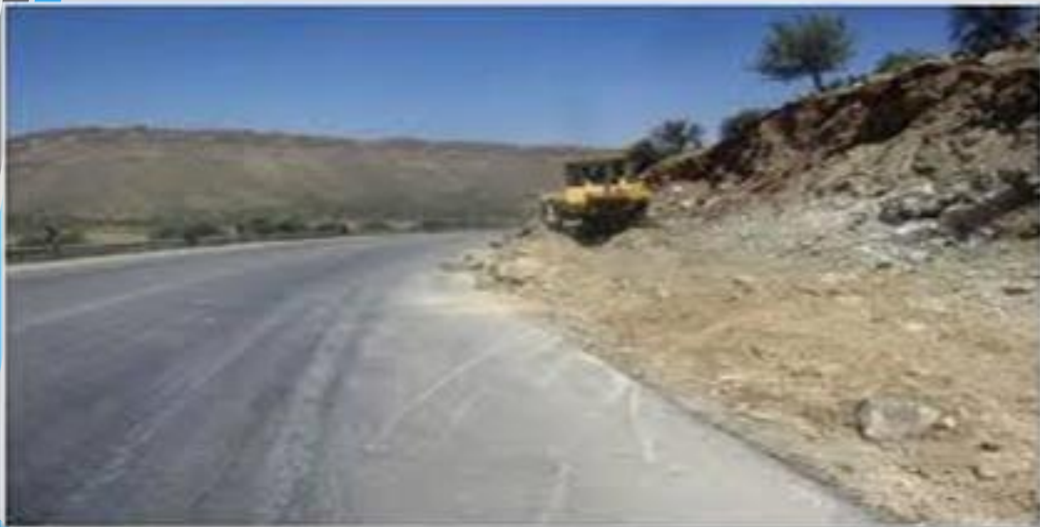
شکل ۱۳: نقطه حادثه خیز بین روستایی بدون خط کشی، تابلو و روشنایی