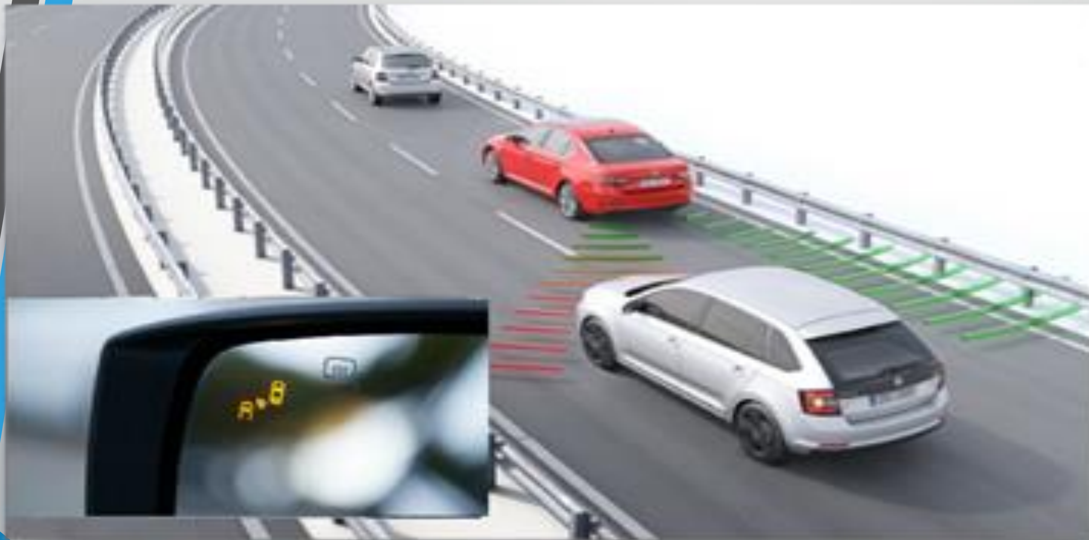
شکل ۱۰: نحوه عملکرد سیستم پایش نقاط کور خودرو